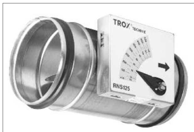
■ Рис. 4. CAV Регулятор серии RN

Таким образом, использование регуляторов постоянного расхода, которые в зарубежной практике обозначаются как CAV регуляторы, позволяет полностью решить вопрос гарантии подачи точных объемов воздуха на этапах проектирования, монтажа и пусконаладки систем вентиляции любой сложности