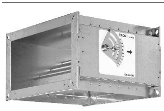
■ Рис. 3. CAV Регулятор серии EN

ляторы серии EN размером до 600 x 600 мм и номинальным расходом воздуха 12 096 м 3 /ч. Точность регулирования для регуляторов серии EN и RN составляет +/- 4 %.